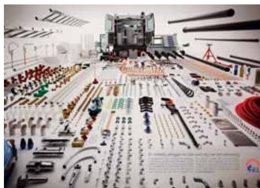
▲ Denne annonsen sto i oppslag i VG dagen etter Stortingsvalget.

Begge annonsene kom også inn i VG helg i oppslag på sidene 2 og 3!