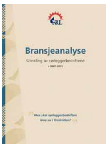
Utdrag fra den kortfattede bransjeanalysen.

Men for å gjøre det enklere for dere, har NRLs Styre besluttet å gjennomføre noen strategikonferanser rundt om i landet, hvor dere vil få innsyn i hvordan slike interne prosesser bør skje. For de virkelig interesserte vil det deretter bli tilbud om å delta i nedsatte strategigrupper, hvor målet vil være å bistå det enkelte foretak med råd og oppfølging for å lage en egen strategiplan. Vi har en spennende tid foran oss!