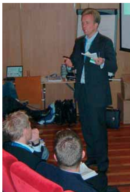
▲ Stortingrepresentant Børge Brende.

NRL vil følge opp Brendes oppfordring om satsing på VA-sektoren og vannrensing på forbruksstedene.